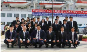
しんきんリレークルーズ 飛鳥II 新生入庫生全員でお見送り

平成最後の4月、鹿児島信用金庫に新生26名が入庫しました。研修期間中には、鹿児島信用金庫の理念や、マナーや挨拶、対応の研修、金融機関に勤める上で必要な知識など基本的なものから、当金庫が行う様々な活動を知り、地域に根ざす金融機関としての役割を学びました。現在、約1ヶ月の研修を経て、各営業店で勉強中です。明るく元気に頑張りますので、皆様よろしくお願ひします。