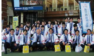
かしんチャレンジマーケットで体験研修