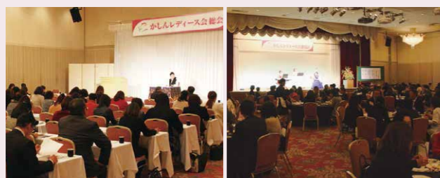
「輝く女性であるために」 フリーアナウンサー中村朋美様 総会 懇親会