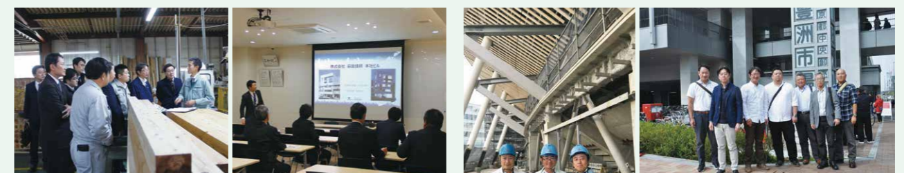
企業視察【図南木材(株)】 企業視察【(株)萩原技研】

会員企業や先進的の事業を行なっている企業や施設の視察研修を定期的に開催し、会員の学びの場となっています。