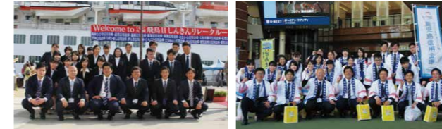
しんきんリレクルーズ 飛鳥II かしんチャレンジマーケットで体験研修 新生全員でお見送り

平成最後の4月、鹿児島信用金庫に新生26名が入庫しました。研修期間中には、鹿児島信用金庫の理念や、マナーや挨拶、対応の研修、金融機関に勤める上で必要な知識など基本的なものから、当金庫が行う様々な活動を知り、地域に根ざす金融機関としての役割を学びました。現在、約1ヶ月の研修を経て、各営業店で勉強中です。明るく元気に頑張りますので、皆様よろしくお祈りします。