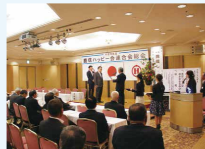
総会 会員増強運動表彰式