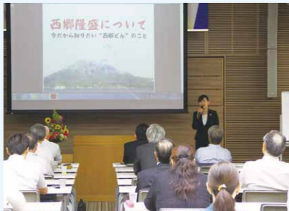
セミナー 講演会:西郷隆盛について 安川あかね氏(城山ホテル鹿児島)