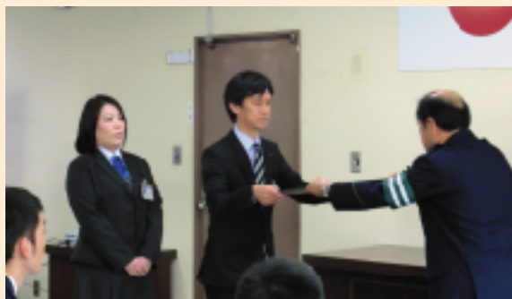
高尾野支店発生事例

また、当金庫ではお客様の大切なご預金をお守りするために、各営業店でも振り込め詐欺等に係る疑いがあるお客様へは職員がお声かけをさせていただいています。現に、お声かけにより振り込め詐欺であることが分かり詐欺を未然に防いだ事例もあり、所轄警察署から表彰を受けております。