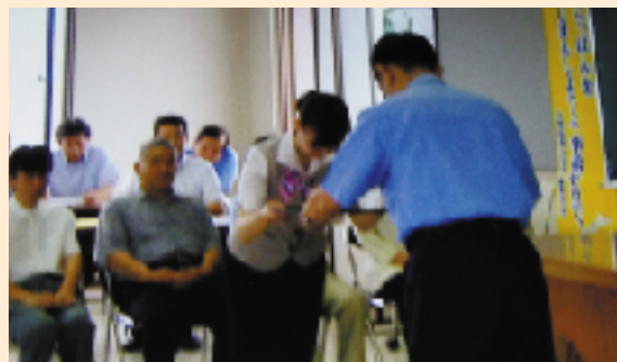
川内支店発生事例

平成25年11月8日午前、支店を訪れた70代男性の不審な態度に窓口係が気づき上司に報告。警察に通報し、振り込め詐欺を未然に防ぎました。